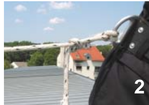
Am Pfahlstich (Brustbund)