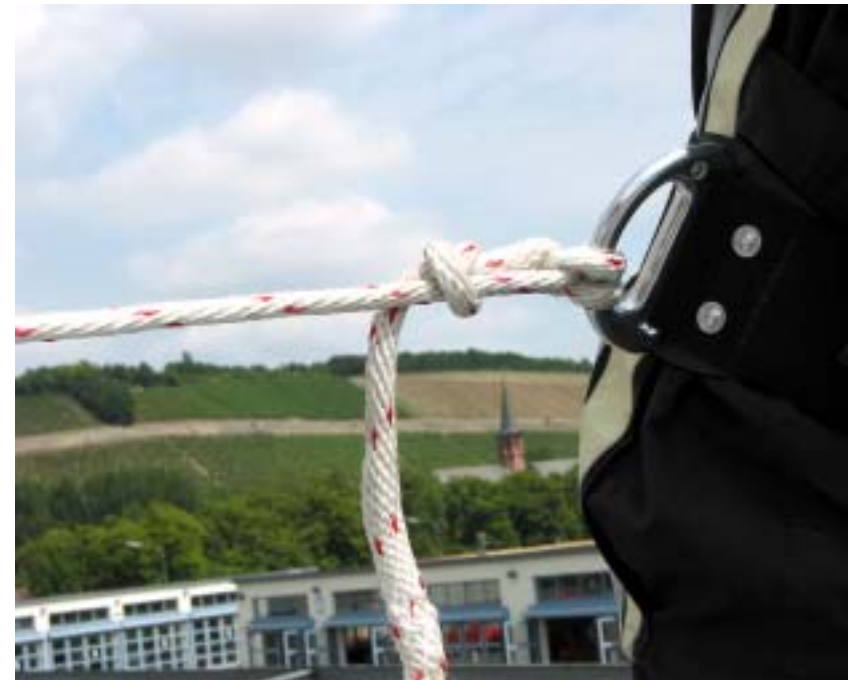
Beispiel: Mastwurf und Spierenstich am Feuerwehr-Haltegurt