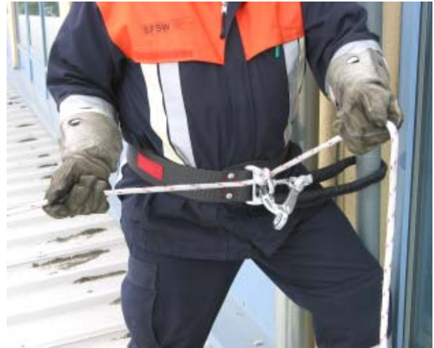
Führen der Feuerwehroleine mit Hilfe des Halbmastwurfs