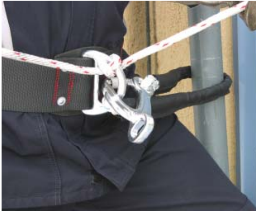
Selbstsicherung unmittelbar am Festpunkt